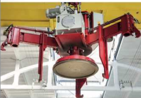
Мобильный пресс / подъемная траверса Atlas 150/150

Лидерство благодаря проверенным технологиям.