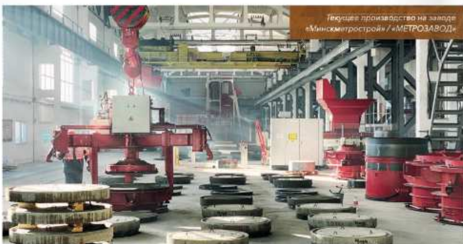
Текущее производство на заводе «Минскметрострой» / «МЕТРОЗАВОД»

можность покинуть Германию, специалисты по монтажу и электрик выехали в Минск и смогли быстро провести монтаж и пуско-наладку. УП «Минскметрострой» выполнило безупречную подготовительную работу и создало все условия для быстрой реализации проекта со стороны заказчика: расчистило цех, заложило новые фундаменты, провело перетяжку линий электропередач и подачи сжатого воздуха, заменило краны, построило опоры и рельсовые пути для новой линии адресной подачи. Prinzing Pfeiffer организовала удаленную поддержку в связи с пандемией и летом отправила своих специалистов в Минск. С самого начала будущие операторы принимали участие в монтаже и вводе в эксплуатацию, а затем прошли обучение в качестве обслуживающего персонала и были сертифицированы для работы на новых установках.