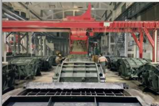
Новая бетонораздаточная система для тоннельной опалубки