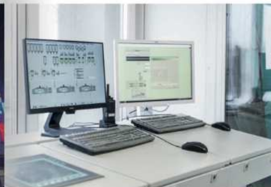
Центральный пульт управления БСУ