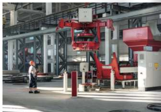
Atlas 150/150 – производство крышек колодцев