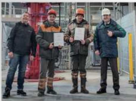
Сотрудники УП «Минскметрострой» получили сертификат об обучении, который дает им право самостоятельно управлять установкой