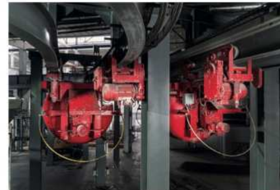
Линии адресной подачи гарантируют точную и непрерывную транспортировку бетонной смеси ко всем установкам и формам на заводе