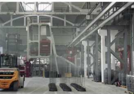
Производство железобетонных труб на радиальном прессе завода «Минскметрострой»

Товарный бетон для стройплощадок загружается из одного из бетоносмесителей. Из второго смесителя бетонная смесь поступает на производство по параллельным линиям адресной подачи. Одна линия адресной подачи ведет в цех к двум новым установкам, а другая - на производство тоннельных элементов для УП «Минскметрострой». Третий бетоносмеситель используется для выпуска специальных смесей бентонита.