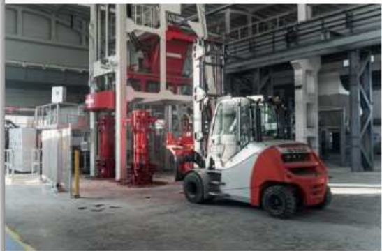
Радиальный пресс RP 1230-4 с вилочным погрузчиком

Радиальный пресс представляет собой установку, которая обеспечивает высокую производительность при небольшом количестве персонала. Он автоматически контролирует состояние уплотнения изделия. Процесс изготовления завершается только после полного уплотнения элемента. В процессе радиального прессования бетонная смесь добавляется в форму контролируемым образом, в то время как процесс уплотнения постоянно контролируется новейшими датчиками. Если фактический показатель уплотнения достигает целевого значения, уплотняющая головка поднимается, при этом время