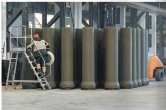
Свежеотформованные бетонные трубы