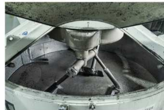
Доступ к бетоносмесителю для проведения техобслуживания осуществляется через большие люки