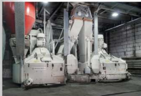
Новые планетарные бетоносмесители серии SX служат для приготовления бетонных смесей как для вибропрессования, так и для вибролитья

УП «Минскметрострой» изготавливает качественные трубы и люки с очень высокой прочностью, герметичностью и размерной точностью. С целью создания идеальной основы для этого качества, была проведена оптимизация качества бетона и его логистики. Prinzing Pfeiffer не только поставила две новые установки, но и начала с базовых технологий: дозирования и перемешивания. Была отремонтирована БСУ башенного типа, смонтирована система адресной подачи бетонной смеси и установлена современная бетонораздаточная система.