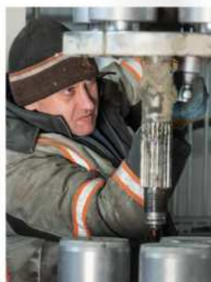
Уплотнительная роликовая головка радиального пресса / замена роликовой головки